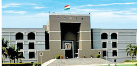
વાલીઓ અને વિદ્યાર્થીઓના હિતમાં ગણત્યા હોતો. ઓનલાઇન શિક્ષણ માટે રાજ્ય સરકારની હાઈકોર્ટમાં રજૂઆત હતી કે કેન્દ્રીય

અમદાવાદ, તા. ૫ ઓનલાઇન શિક્ષણ બાબતે હાઈકોર્ટે આજે મહત્વ નો યુક્તિ આપ્યો છે. સ્કૂલો પોતાના યુક્તિમાં જપ્તિયાં કે સ્કૂલોની સંબંધી ફી માટેની નિષેધ વધુ પડતો છે. સરકારી સ્કૂલ સંચાલકો સાથે વાતાઘાટો કરી સોના હિતમાં નિર્ણય લઈ ટ્યુશન ફી મુદ્દે નવો દરખાસ પ્રસિદ્ધ કરે. હાઈકોર્ટે એ રાજ્ય સરકાર ને ફી મુદ્દે નવો પરિચય બહાર પાડવા આદેશ કર્યો છે. સાથે જ કહ્યું છે કે સંચાલકો અને વાલીઓ નો હિત જાળવી રહે તે મુજબનો પરિચય રાખવા સરકાર ને દેશર કરી છે. સંચાલકો ફી અંગે સરળ